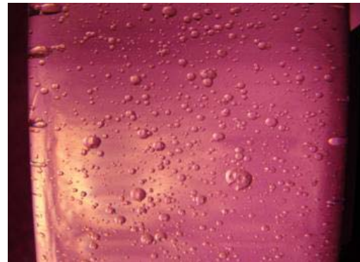
شکل ۲: نمونه‌ای از عکس‌های گرفته شده از قطره‌ها.

در این کار تجربی، برای مدلسازی ماکزیم قطر متوسط قطره‌ها، از روش تحلیل ابعادی استفاده شده است.